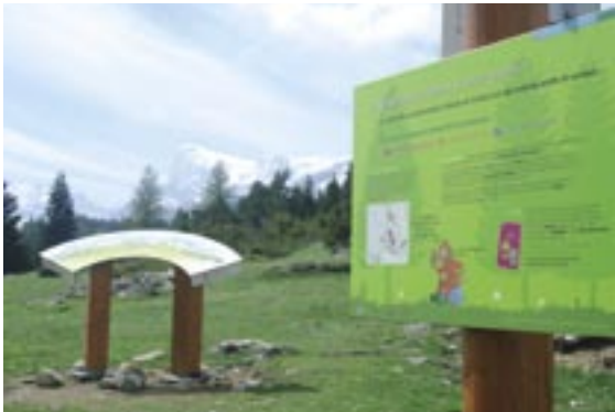
Photo: les totems et la table d'orientation au Collet du Tât.

Coût de l'opération 75 000 euros / Communauté de Communes du Dévoluy.