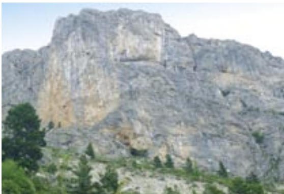
Photo: La montagne des Gicons depuis le sentier d'accès au site d'escalade.

Coût de l'opération 33 000 euros / Communauté de Communes du Dévoluy.