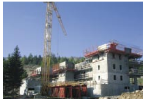
Photo: Les travaux de L'Eden des cimes du groupe Seclym Lotimmo aux Chaumattes.

Quel chantier! Les travaux de l'Eden des Cimes (66 logements en pleine propriété / Groupe Séclym Lotimmo) et de La Crête des Bergers (25 logements en résidence de tourisme*** / Transmontagne Résidences) viennent de reprendre. D'autres programmes suivront: Les Aiguilles (quatre chalets en pleine propriété situés à proximité de la Base de loisirs / Groupe Ruspini), Le Domaine du Loup Blanc (5 petites résidences de 33 logements en pleine propriété, situées à l'emplacement de l'actuel centre équestre / Groupe Ruspini) et enfin L'Obiou construite en continuité des résidences des Fontettes (58 logements en pleine propriété / Groupe Séclym Lotimmo).